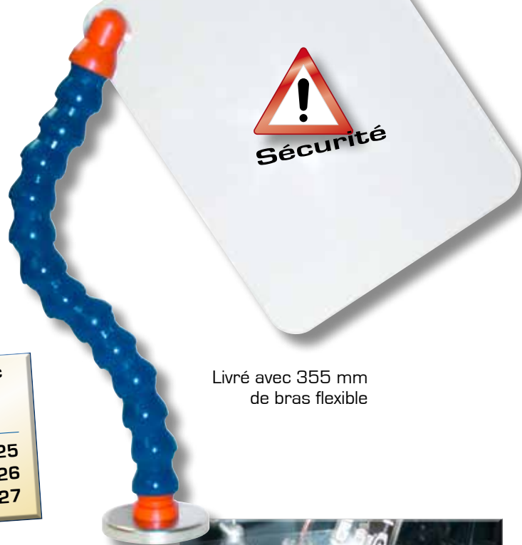
Livré avec 355 mm de bras flexible